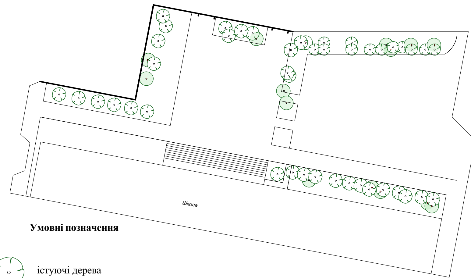
Опорний план М 1:500

Умовні позначення існуючі дерева дерева пошкоджені